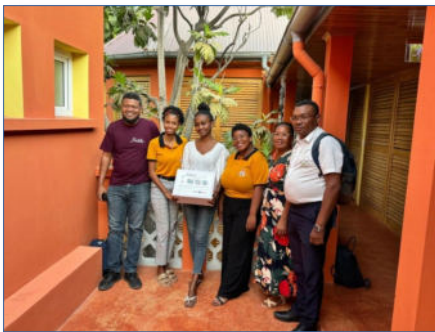
Rencontre avec les partenaires.