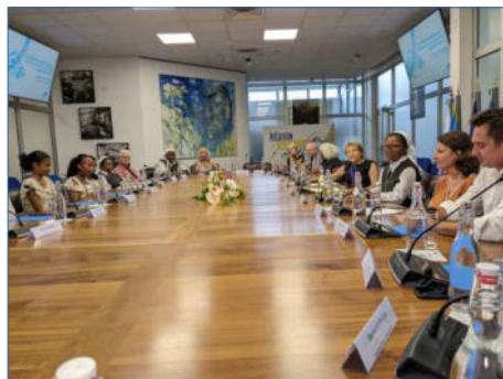
La Remise des Prix à La Région en octobre 2023