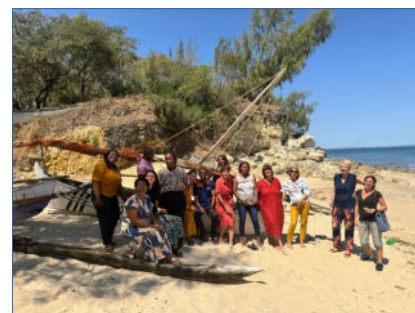
Découverte de l'environnement de proximité de l'école

Pour favoriser des véritables changements durables et bénéfiques pour chacun dans l'acquisition de connaissances et de compétences, l'évolution des comportements et l'adaptation mutuelle, la qualité des échanges a été au cœur du projet, pour les participants (apprenants) comme pour les intervenants (formateurs). La place des intervenants a également été pensée pour contribuer à créer un environnement apprenant. Quand un intervenant réalisait sa séquence, les autres faisaient partie des participants.