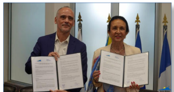
Signature de l'accord-cadre Francophonie