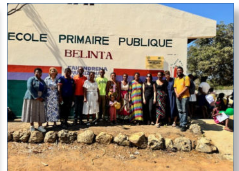
Projet de coopération avec Majunga « Récif art »