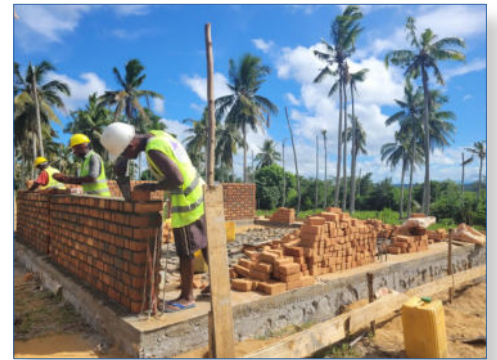
Aide à la construction d'une école à Sambava Madagascar

L'AMOPA-Réunion a décidé de participer financièrement à la construction de cette école.