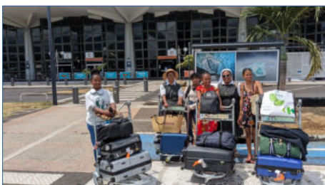
La venue des 5 lauréates 2023 du concours « Plaisir d'écrire... » et de leur accompagnatrice