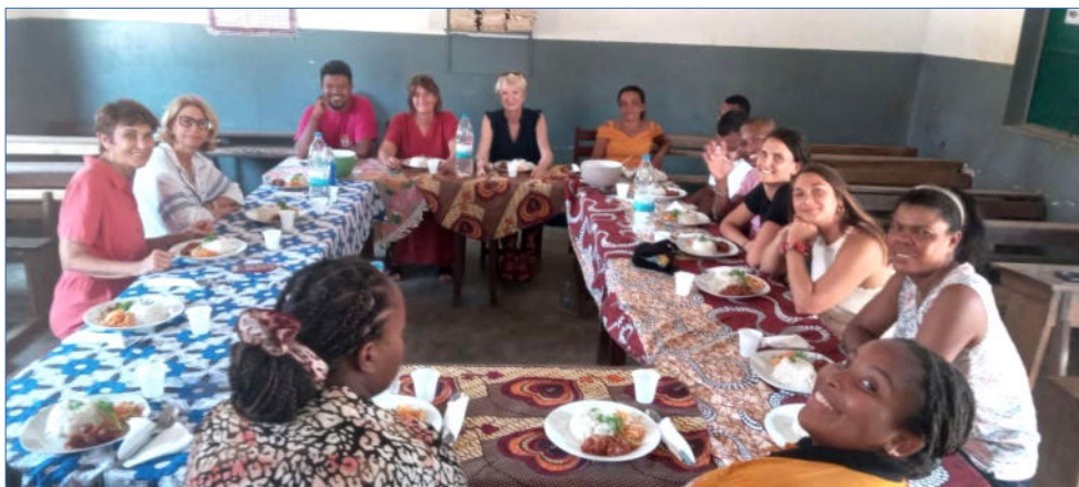
Repas préparé par le chef cuisinier de l'association et partagé tous les jours dans la simplicité et la bonne humeur.

Au nom de l'AMOPA, je remercie la Région Réunion d'avoir fait appel aux compétences de notre association pour participer à la réalisation de ce beau projet de coopération. Une magnifique aventure humaine !