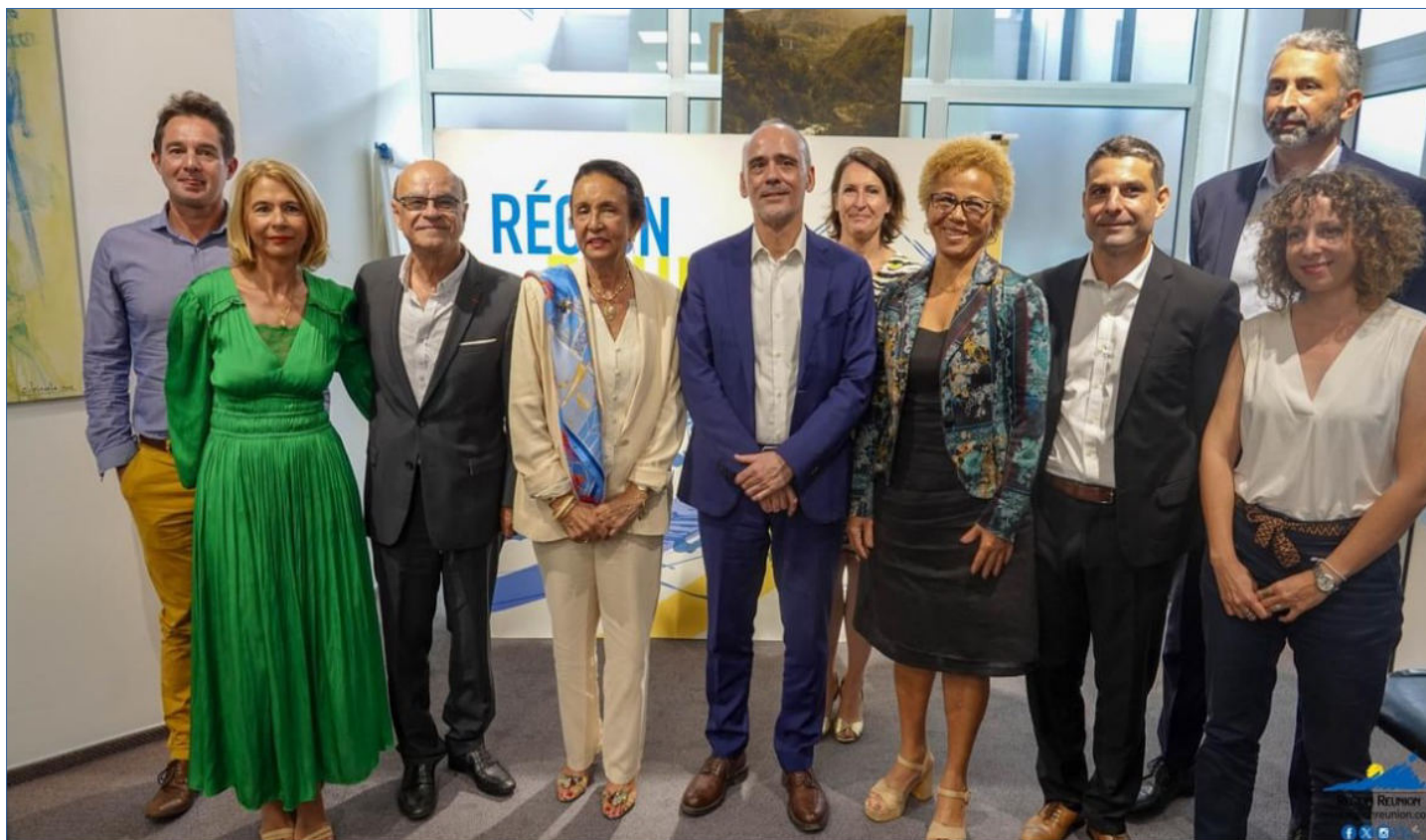
La photo souvenir de l'évènement

Suite à ces différentes prises de parole, la presse a poursuivi par les questions et autres interviews d'usage avant que Mme la Présidente de Région et Monsieur le directeur général de France Éducation Internationale procèdent à la signature solennelle de l'accord-cadre. La séance s'est clôturée sur des encouragements et remerciements chaleureux.