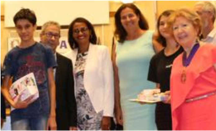
COLLÈGE CLASSES DE 3°