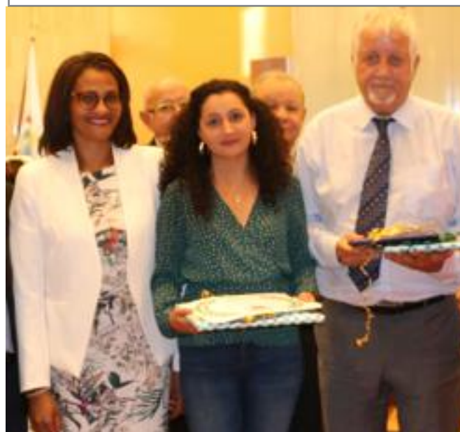
COLLEGE CLASSES DE 6°