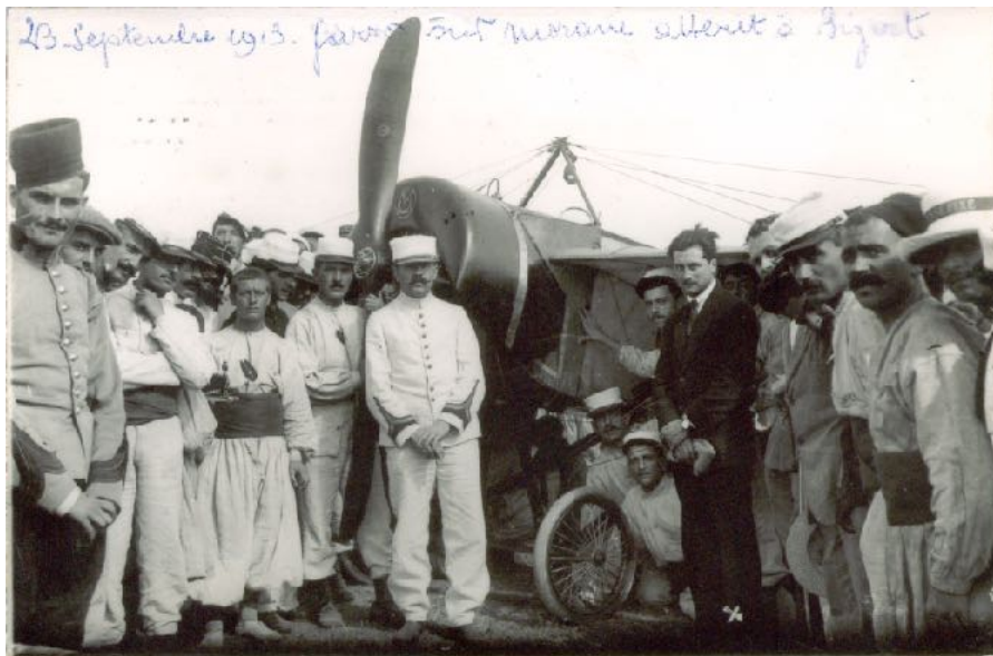
1913 (23 septembre) – Garros à Bizerte

1913 (Octobre) - Circuit des lacs italiens (Côme - Pavie - Côme) - Garros remporte l'épreuve sur un hydravion Morane-Saulnier .