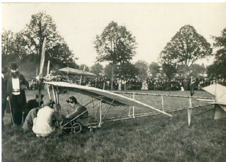
1910 – Garros et sa Demoselle à la Ferté-Vidame (Eure-et-Loir)

1911 (4 septembre) - Cancale (Ille-et-Vilaine) - Garros monte à 3 950 mètres - Record mondial de hauteur battu !