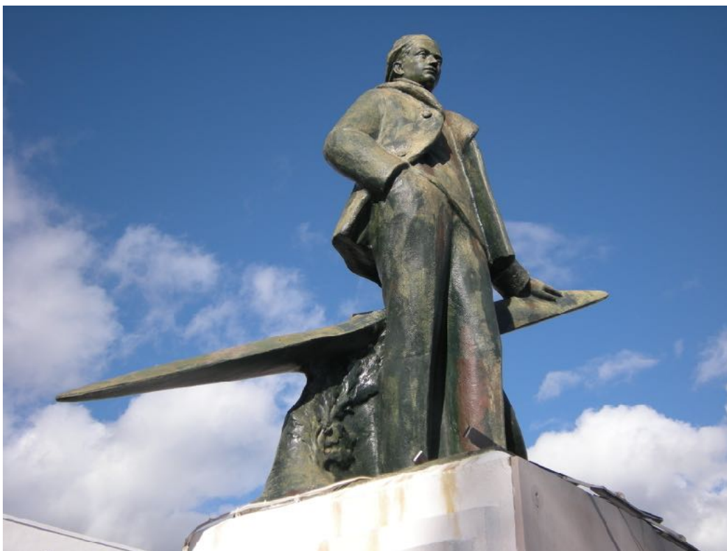
Statue de Roland Garros au Barachois à Saint-Denis (Œuvre du statuaire Étienne Forestier)

1918 (5 octobre) - Sud-ouest de Vouziers (Ardennes) - Disparition de Roland Garros, dans un dernier combat aérien.